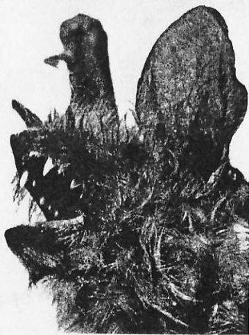
Fig. 2. Myotis emarginatus (Capul lăcătu).